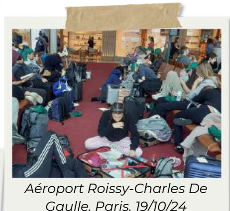
Aéroport Roissy-Charles De Gaulle, Paris, 19/10/24

En raison de l'annulation de notre vol pour Paris, nous avons été logés à l'hôtel Océania en attendant notre vol du lendemain matin.