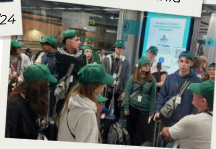
Aéroport de Nantes, 19/10/24