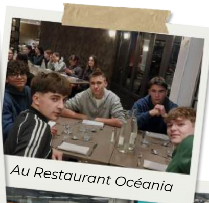
Au Restaurant Océania