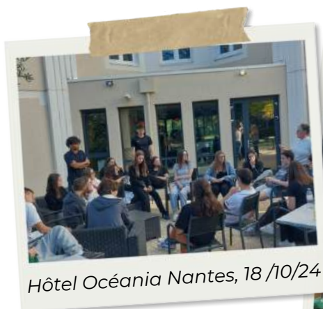
Hôtel Océania Nantes, 18/10/24