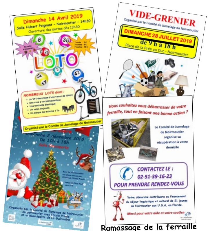
Ramassage de la ferraille

Comme à l'accoutumée, nous devons gagner de l'argent afin que toutes les familles noirmoutrines, même à revenu modeste, puissent permettre à leurs enfants de réaliser leur rêve américain. Pour cela nous devons effectuer des actions avec les jeunes et leurs parents pendant les 2 ans de préparation. Aussi nous comptons sur la solidarité noirmoutrine et son soutien sans faille en faveur du Comité de Jumelage.