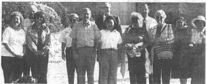
Douze représentants de quatre villes du nord-ouest de la Floride ont été reçus par la municipalité de Noirmoutier-en-l'île.

L'étonnement fut grand au sein du Comité de jumelage de Noirmoutier à la réception, il y a quelques mois, d'un courrier émanant d'une ville de Floride, Crestview, formulant le désir d'étudier la possibilité d'établir avec Noirmoutier des liens culturels et d'amitié. En effet, c'est loin l'Amérique ; c'est grand ; quel point de rencontre pouvait-il y avoir entre les Américains et des Noirmoutrins ? Puis d'échange de courrier en échange de courrier, devant l'insistance et la gentillesse déployée de l'autre côté de l'Atlantique, la municipalité décida de recevoir cette délégation afin de pouvoir mieux répondre à leur demande.