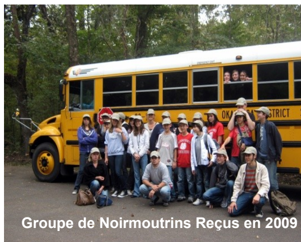
Groupe de Noirmoutrins Reçus en 2009

En 2009 un groupe de 20 collégiens et 14 accompagnateurs dont le Maire de Noirmoutier et son épouse étaient reçus à Crestview dans les familles américaines et à la High School, puis, en 2012, un deuxième groupe composé de 21 collégiens, de 10 accompagnateurs et de 2 représentants de l'IUT de la Roche sur Yon. En 2015 un 3 ème groupe s'envolera vers les USA.