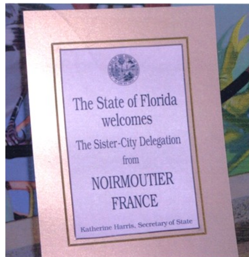
Septembre 2001, réception au Capitole de Tallahassee.