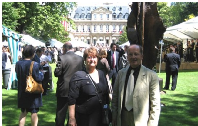
Le Président du Comité de Jumelage de Noirmoutier reçu le 4 Juillet 2008 à l'Ambassade des USA à Paris.