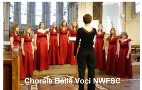
Chorale Belle Voci NWFSC

Crestview Sister City member joins the Legion of Honor