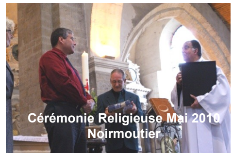
Cérémonie Religieuse Mai 2010 Noirmoutier

Participation aux cérémonies religieuses à Noirmoutier et à Crestview etc.