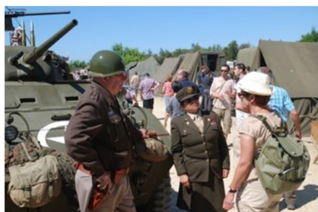
Reconstitution Camp Militaire 1944

Les cérémonies et l'inauguration de la stèle ont eu lieu en présence de plusieurs milliers de personnes. Les discours et les témoignages ont suscité beaucoup d'émotion.