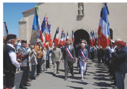
Défilé Militaire - 50 Porte-drapeaux