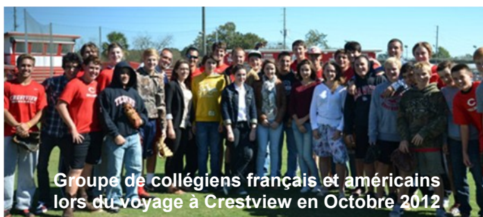
Groupe de collégiens français et américains lors du voyage à Crestview en Octobre 2012