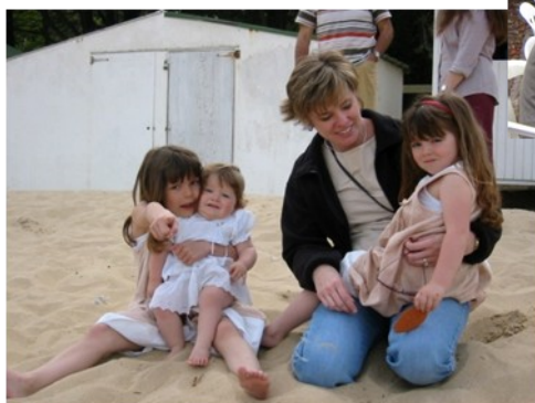
A la plage avec les petits enfants de la famille d'accueil