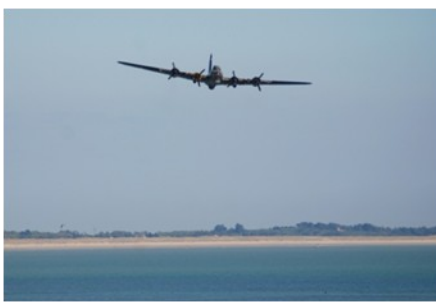
Meeting Aérien avec Vol d'un B17