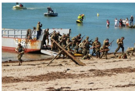
Reconstitution Débarquement 06/06/44