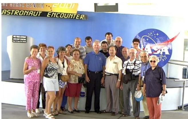
Septembre 2001, accueil à Cap Canaveral par Jean-Loup Chrétien, Astronaute Français.