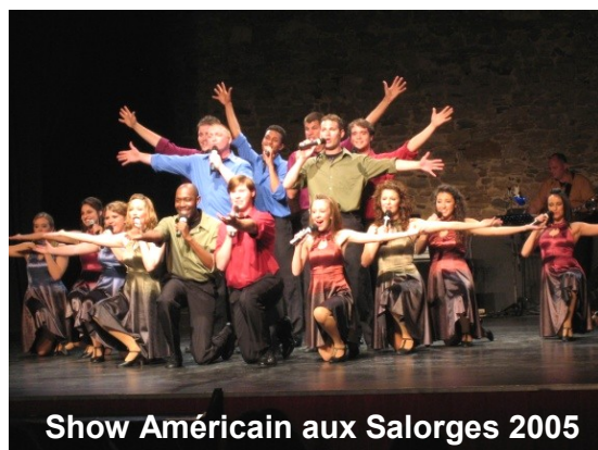
Show Américain aux Salorges 2005

Depuis 1997, tous les deux ans, des groupes de 40 à 45 étudiants de l'Université de Niceville NWFSC, avec leurs professeurs et leurs accompagnateurs, viennent régulièrement dans nos familles et nous offrent des "American Show" et des concerts dans les églises.