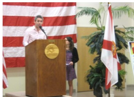
Chambre de Commerce de Crestview