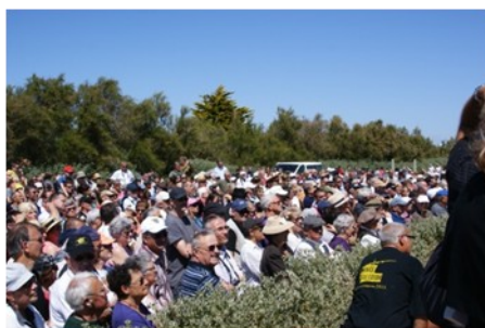
Foule Immense Cérémonie de la Stèle