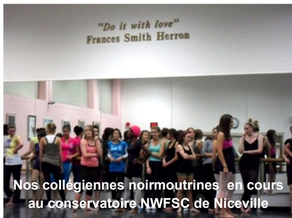
Nos collégiennes noirmoutrines en cours au conservatoire NWFSC de Niceville

La compagnie de Danse "Force Jazz", à deux reprises, a été reçue à l'Université NWFSC à Niceville pour faire des stages de danse au conservatoire de l'Université et produire leurs spectacles à la population locale.