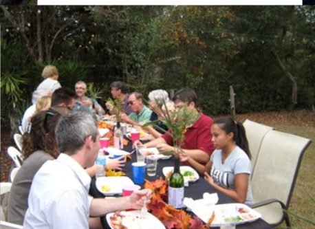
Pique-nique en famille