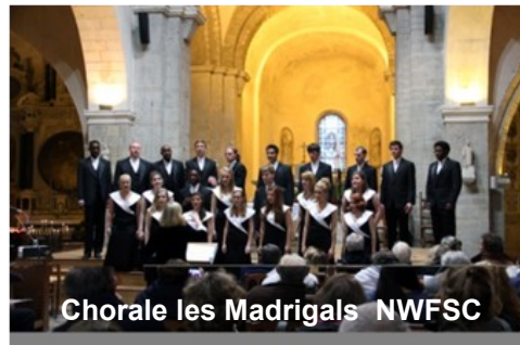
Chorale les Madrigals NWFSC

Concerts dans les Eglises de l'Ile de Noirmoutier par les Madrigals et Belle Voci.