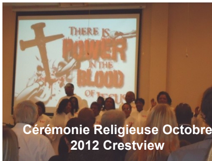
Cérémonie Religieuse Octobre 2012 Crestview

Cultures américaine et française sont vécues de part et d'autre de l'Atlantique