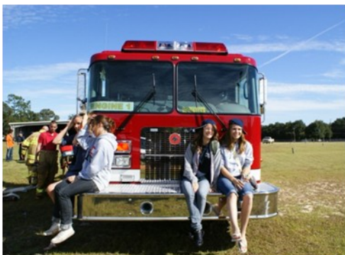
Rencontres avec les personnalités locales, la Police, les Pompiers, différentes associations sportives, culturelles, Chambre de Commerce etc.