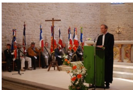
Cérémonie Religieuse Œcuménique