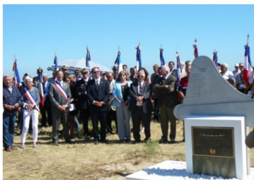
Le Consul des USA Robert Tate et les membres, présents, des familles de l'équipage du B17

Après une cérémonie religieuse à l'Eglise de la Guérinière à la mémoire de tous les disparus lors de la WWII, un grand défilé se dirige vers le lieu de l'inauguration de la stèle érigée face à la plage où a amerri, en catastrophe, le B17 le 4 Juillet 1943.